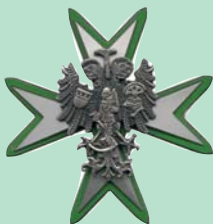
Silbernes Verdienstkreuz des Stadtverband Kölner Schützen