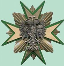
Goldenes Verdienstkreuz mit Eichenlaub

des Stadtverband Kölner Schützen von 1901 e.V.