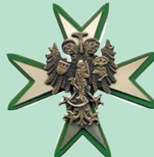
Goldenes Verdienstkreuz des Stadtverband Kölner Schützen