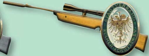
Goldene Jugendverdienstnadel des Stadtverband Kölner Schützen