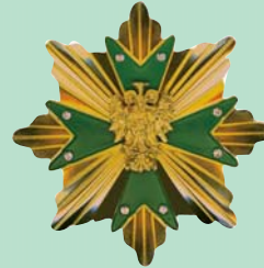
Verdienstkreuz im goldenen Stern mit Brillanten des Stadtverband Kölner Schützen