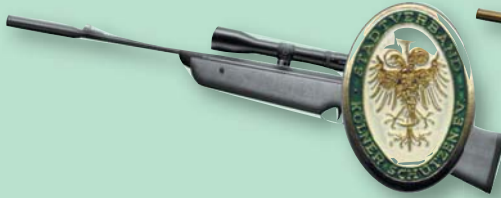
Silberne Jugendverdienstnadel des Stadtverband Kölner Schützen

des Stadtverband Kölner Schützen von 1901 e.V.