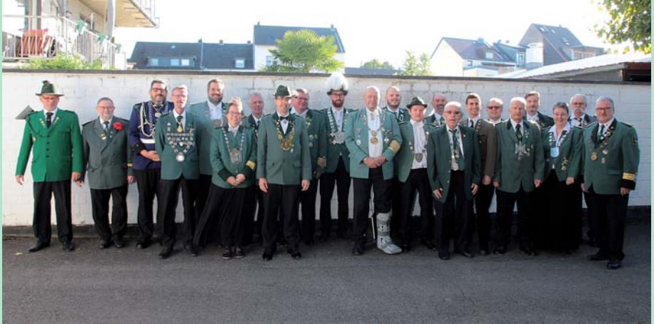
Könige vor dem Stadtkönigsschießen in Flittard 2022