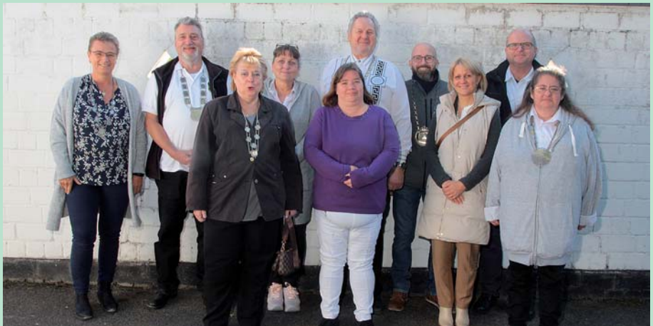
Bürgerkönige vor dem Stadtbürgerkönigsschießen in Flittard 2022