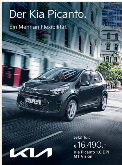
Abbildung zeigt kostenpflichtige Sonderausstattung.

oder auch im Internet unter: www.ah-barthel.de